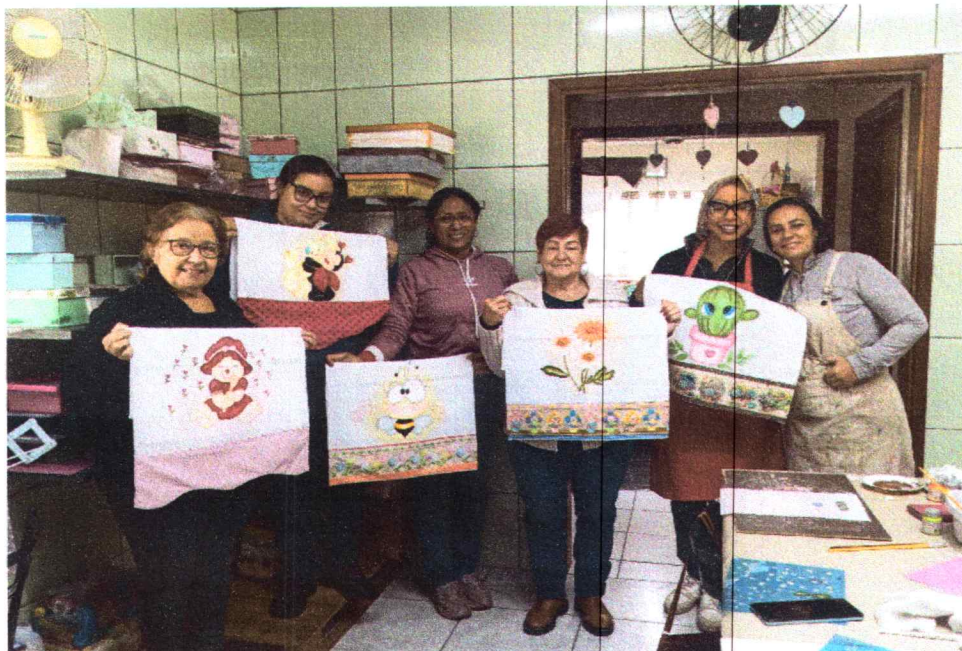
Pintura em Tecido